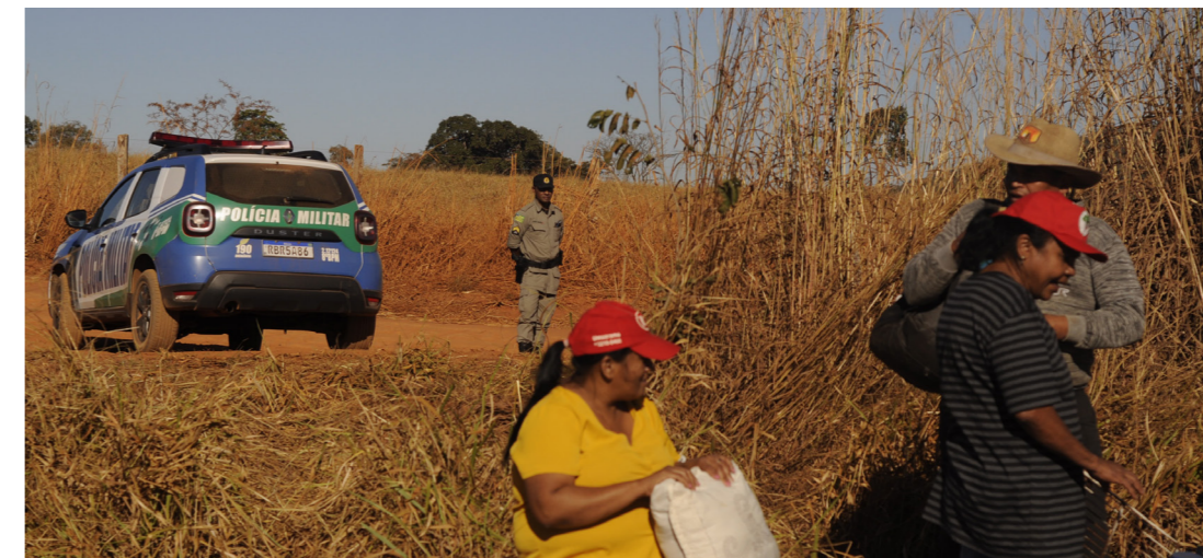
Reocupação da Fazenda São Lukas, hoje Acampamento Dona Neura - município de Hidrolândia (GO)

O período foi marcado pelo aumento de casos registrados de trabalho escravo