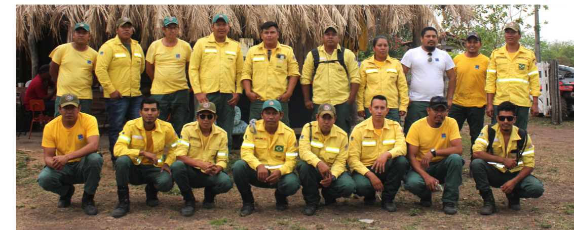
Brigadistas da comunidade Alves de Barros, Tomazia e São Jose – Território Kadiwéu (MS)

Acompanhe: www.agroefogo.org.br | @agroefogo