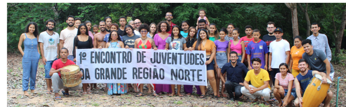
No Tocantins, o momento contou com trocas de experiências e esquetes teatrais com as pautas vivenciadas

Em cada um dos encontros, os grupos se sentiram desafiados a compartilhar o que viveram e aprenderam com suas amigas, vínculos familiares, comunidades e paróquias, sempre na disposição de resistir, não fugir e se somar às lutas dos povos da floresta, que estão e são ameaçados constantemente.