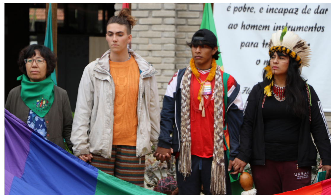
Os dias de evento tiveram início com místicas sobre as lutas das pessoas LGBTI+ do campo, das águas e das florestas.

A importância de momentos como o Seminário se dá, ainda, para o fortalecimento de uma identidade política que caminha na contramão da hegemonia do patriarcado e que expõe o aprofundamento das crises do capitalismo, que acirram as violências contra a população LGBTI+. Para subverter essa lógica perversa de extermínio e superexploração, é preciso reconhecer, de uma vez por todas, que “Sem LGBTI+, não há Revolução!”.