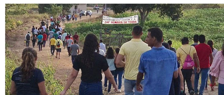
Rafael Oliveira/CPT João Pessoa