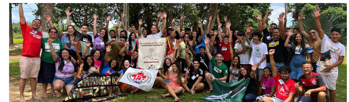
Juventudes do Brasil e Bolívia se encontraram no Acre para refletir sobre seu papel na luta e defesa dos territórios

Pensando sua realidade a partir do chão em que pisa, cada grupo de jovens mostrou um pouco do que é ser parte de um mosaico de realidades: juventude do campo, urbana, indígena e em meio às diversidades. Momentos de mística trouxeram sempre mensagens de comunhão com a Terra, contemplando-a como Mãe e