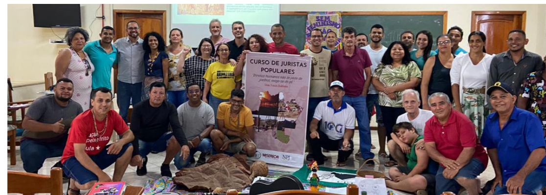
Equipe CPT Regional Rondônia

É a partir desta necessidade de formação de lideranças rurais em legislação, para atuarem como agentes multiplicadores na luta e garantia dos direitos, que a CPT realiza o Curso de Juristas Populares, com apoio da agência Climate and Land Use Alliance (CLUA). O destaque, nos anos de 2022 a 2024, é para a Grande Região Noroeste (Acre, Amazonas, Rondônia e Roraima) e o pólo conhecido como MATOPIBA (Maranhão, Tocantins, Piauí e Bahia), a nova fronteira do agronegócio, que tem gerado muitos conflitos com as comunidades e a busca por conhecimento das instâncias judiciais,