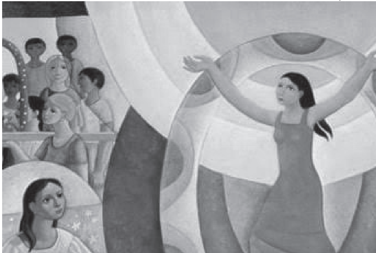
Ilustração: Cerezo Barredo

Ungiu os pés de Jesus e os enxugou com os cabelos. (Jo 12,3)